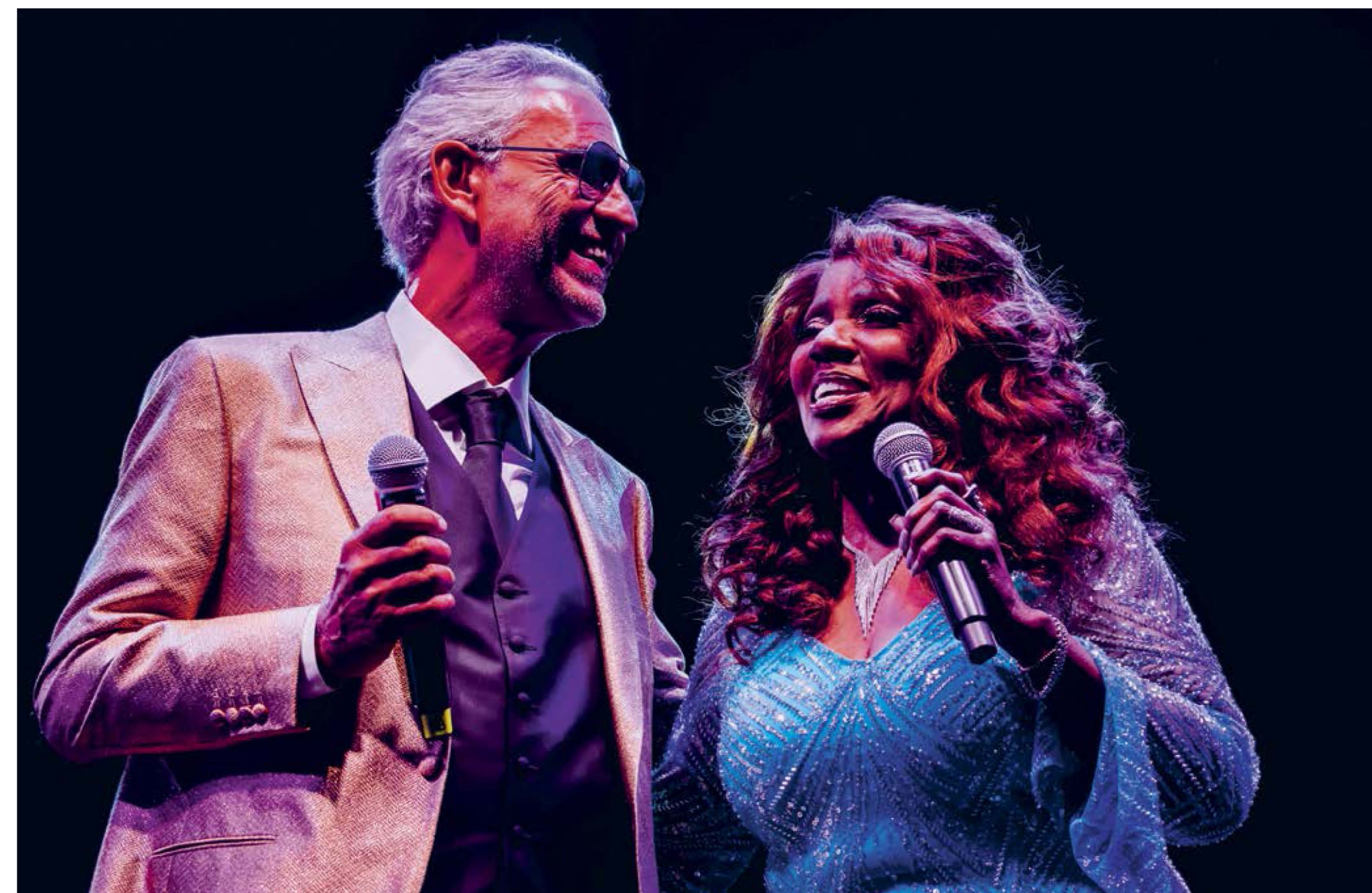
Andrea Bocelli, Gloria Gaynor

Alpemare is a collection of unforgettable places, events and above all, extraordinary people