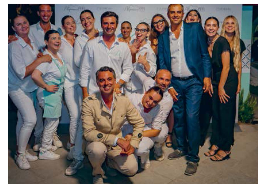
Lo staff Alpemare