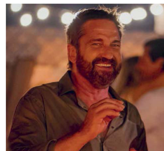
Gerard James Butler