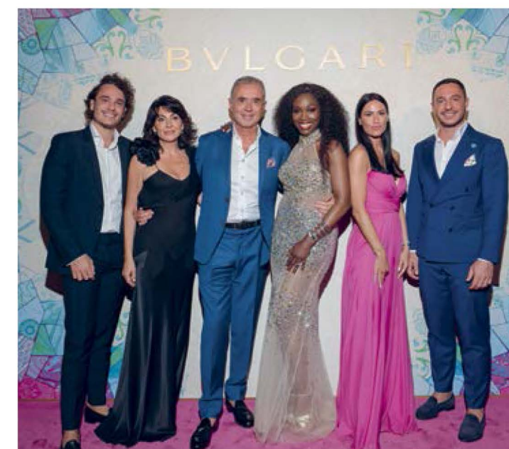
La Famiglia Bartorelli con Cena West